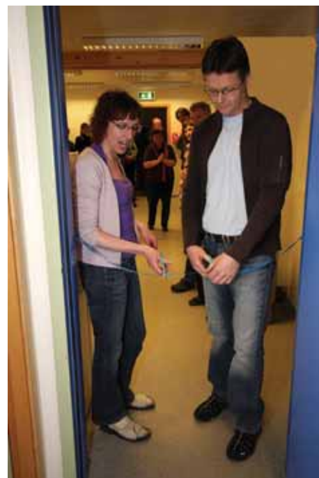
Viðbót við rannsóknáðstöðu vígð. JRB.

Starfssemi héraðssetrana var með svipuðu sniði og áður. Setrin sinna öllum landgræðslutengdum verkefnum innan síns starfssvæðis og hefur verkefnum innan þeirra fjölgað jafnt og þétt síðustu árin. Litlar breytingar urðu á starfsmannahaldi innan þeirra. Þó fjölgaði um einn starfsmann á héraðssetrinu á Hvanneyri og þar sem ekki hafði tekist að manna héraðssetrið á Klaustri var ákveðið að leggja það tímabundið af og sinna starfssvæði þess frá Gunnarsholti og Höfn.