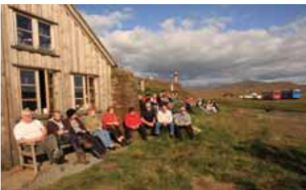
Áð í Sænautaseli. JRB.

Að þessu sinni bauð Landgræðslufélag Héraðsbúa til landgræðsludags 21. ágúst í samstarfi við Landgræðsluna. Fjöldmenni tók þátt í atburðinum. Ekið var um Hérað og landgræðslusvæði félagsins skoðuð. Áð var í Sænautaseli, þar sem gestir nutu veitinga í boði landgræðslufélagsins. Um kvöldið var samkoma á Eiðum og buðu heimamenn upp á fjölbreytta hátíðardagskrá.