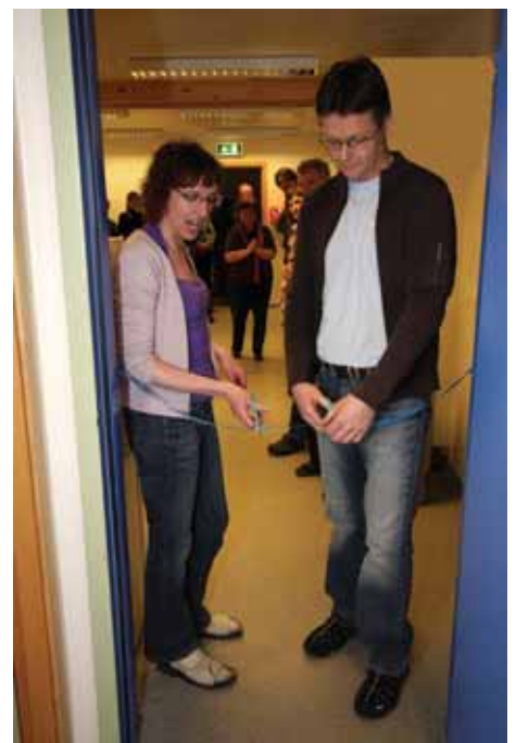
Viðbót við rannsóknáðstöðu vígð. JRB.

Starfssemi héraðssetrana var með svipuðu sniði og áður. Setrin sinna öllum landgræðslutengdum verkefnum innan síns starfssvæðis og hefur verkefnum innan þeirra fjölgað jafnt og þétt síðustu árin. Litlar breytingar urðu á starfsmannahaldi innan þeirra. Þó fjölgaði um einn starfsmann á héraðssetrinu á Hvanneyri og þar sem ekki hafði tekist að manna héraðssetrið á Klaustri var ákveðið að leggja það tímabundið af og sinna starfssvæði þess frá Gunnarsholti og Höfn.