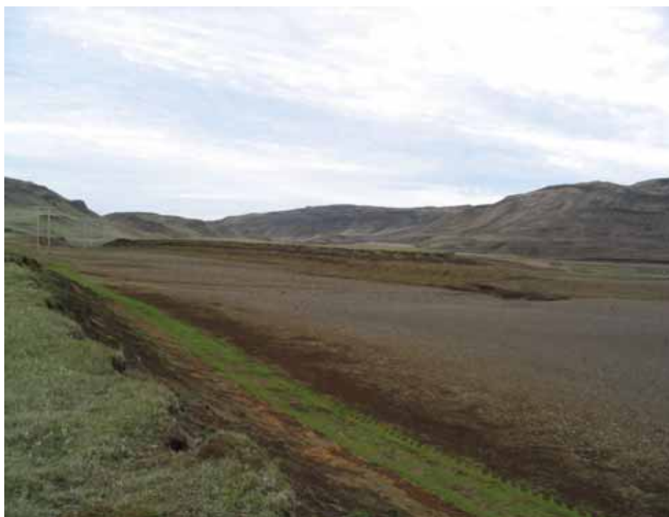
BGL uppgræðsluvæði í Fossnesi í Skeiða- og Gnúpverjahreppi. SJ.

Í byrjun hausts voru haldnir svokallaðir BGL dagar á Suður- og Vesturlandi. Markmið þeirra er að skapa vettvang fyrir BGL bændur, starfsmenn Landgræðslunnar og aðra áhugasama um vistheimt raskaðra vistkerfa til að hittast og heyrja hvað er nýjast í fræðunum en ekki síður að miðla eigin reynslu af uppgræðslustarfinu. Dagskráin var fjölbreytt í báðum tilfellum og mál manna að þar hafi verið framreidd hæfileg blanda fagþekkingar og beinnar reynslu. Góð þátttaka var á BGL dögnum; um 30 manns mættu í