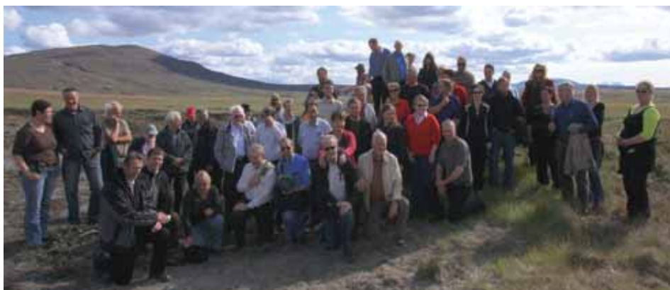
Gestir landgræðsludagsins á Héraði í landgræðslugirðingu Landgræðslufélags Héraðsbúa. JRB.

Áætlun m.v. dreift magn og áburðarnotkun 200 kg/ha.