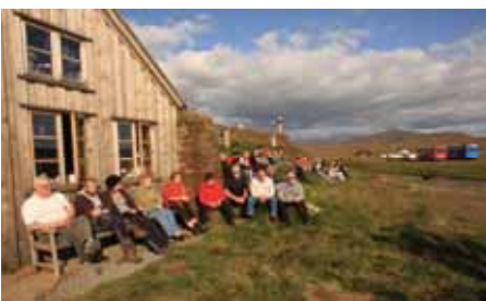
Áð í Sænautaseli. JRB.

Að þessu sinni bauð Landgræðslufélag Héraðsbúa til landgræðsludags 21. ágúst í samstarfi við Landgræðsluna. Fjöldmenni tók þátt í atburðinum. Ekið var um Hérað og landgræðslusvæði félagsins skoðuð. Áð var í Sænautaseli, þar sem gestir nutu veitinga í boði landgræðslufélagsins. Um kvöldið var samkoma á Eiðum og buðu heimamenn upp á fjölbreytta hátíðardagskrá.