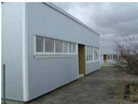
Íbúðarhúsin á Akurhóli. JRB.

Landgræðslan fékk til umráða húsakost Akurhóls, þar sem áður var rekið vistheimili fyrir drykkjumenn. Tvö íbúðarhús á Akurhóli voru gerð upp. Í hvoru húsi eru fimm herbergi auk eldunaraðstöðu og setustofu.