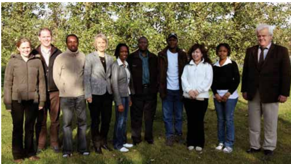
Nemendur og forsvarsmenn Landgræðsluskólans. JRB.

Vefurinn er gerður í vefumsjónarkerfinu Joomla, sem er frjálst og opinn hugbúnaður. Er það í samræmi við stefnu stjórnvalda, sem samþykkt var á árinu „að gefa frjálsum hugbúnaði sömu tækifæri og séreignarhugbúnaði þegar tekin er ákvörðun um kaup á nýjum búnaði og ávallt skal leitast við að gera sem hagstæðust innkaup“.