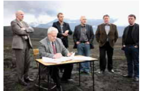
Samkomulag um átak ríkisstjórnarinnar til að takast á við afleiðingar eldgossins var undirritað í nágrenni gosstöðvanna.

Með farsælu samstarfi Vega- gerðarinnar og Landgræðslunnar við flóðavarnir og með stöðugum uppmokstri úr farvegum ána tókst að koma í veg fyrir stórfelld tjón á byggð og samgöngumannvirkjum.