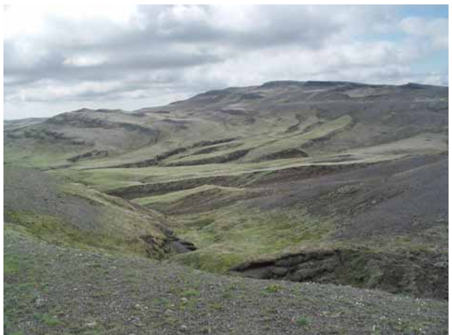
Landið hart leikið. Mikil verkefni í endurheimt landkosta.

áburðardreifingu og sáningu, auk þátttöku í áburðarkostnaði. Auk þess dreifa fjölmargir þátttakendur tilbúnum og lífrænum áburði umfram samningsbundið magn. Það má því gera ráð fyrir að virk BGL svæði séu mun stærri en samningar segja til um.