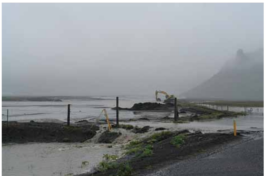
Enn er barist við aurframburð í Svaðbælisá.

Í hamförunum sáu landsmenn hversu gríðarleg áhrif öskufalls geta verið þegar dagur varð sem