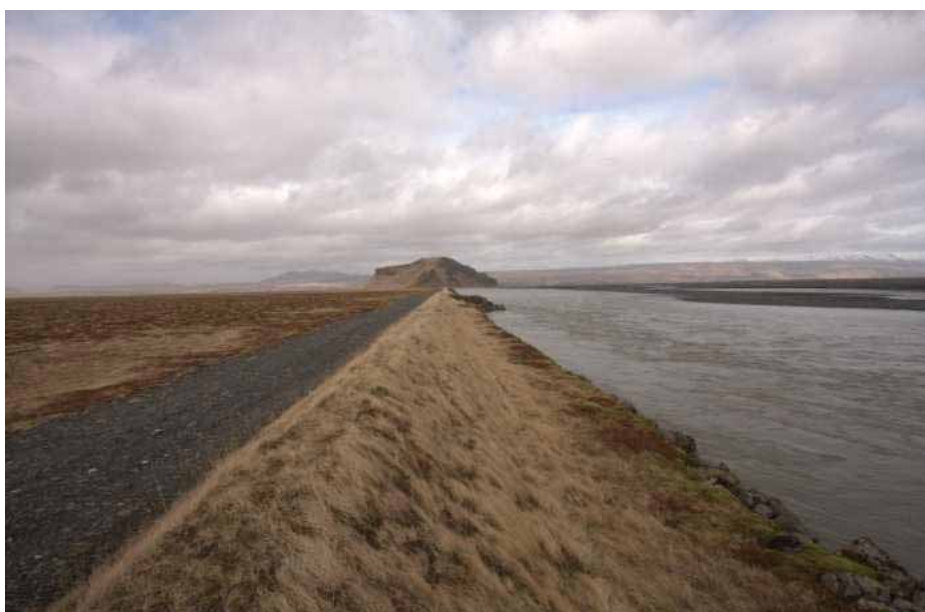
Varnargarður við Markarfljót. Stóra Dímon í baksýn.

Árið 2010 var unnið að 57 verkefnum alls og var þeim lokið að undanskildum 6 verkefnum á Norðurlandi eystra og