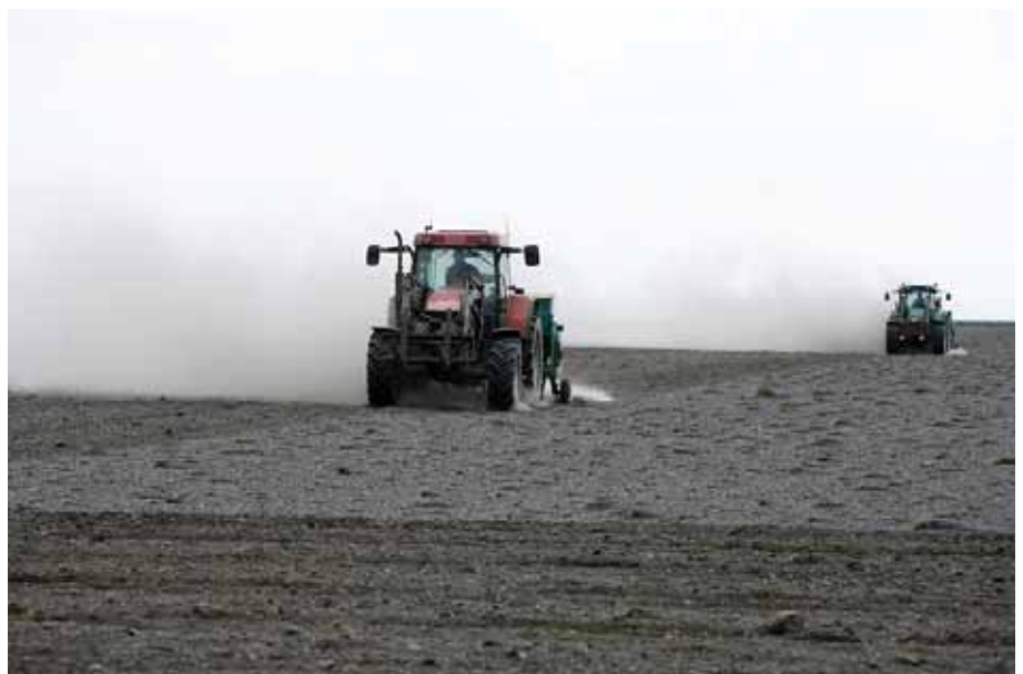
Unnið var við heftingu öskufoks í byggð. Alls var sáð og borið á 1.100 ha.