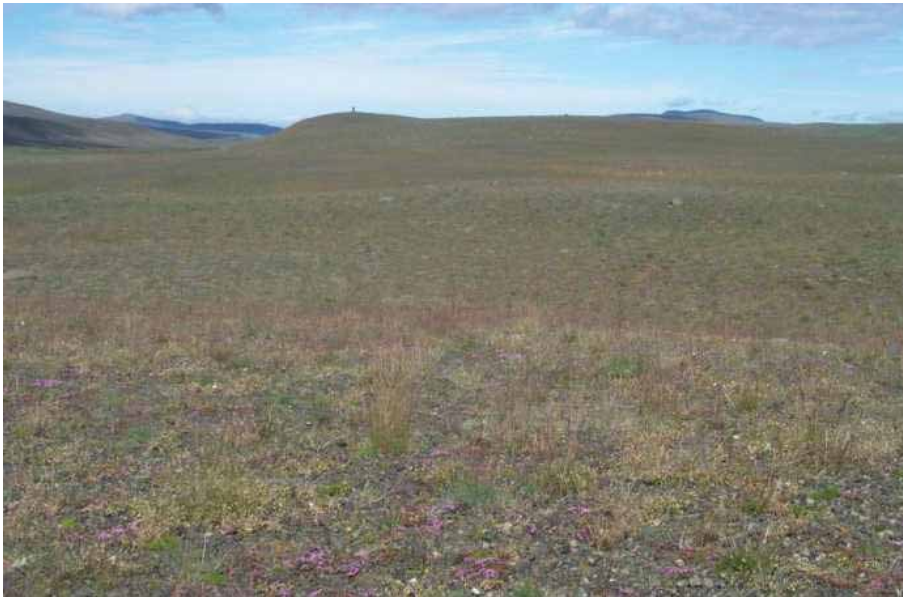
Góður árangur eftir þriggja ára áburðargjöf.

Nú er unnið að kortlagningu allra BGL svæða og mun þeirri vinnu ljúka á árinu 2011. Þá munu liggja fyrir nákvæmari tölur um BGL verkefnið en hingað til hefur verið.