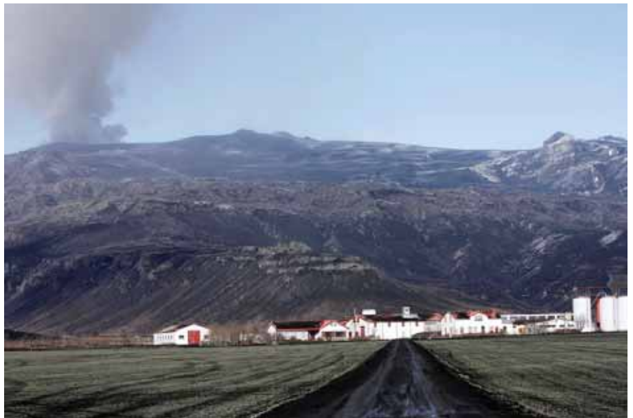
Grös koma upp úr öskunni á Þorvaldseyri í lok eldgossins.

Þetta sýnir okkur mikilvægi þess að hugleiða landnýtingu á virkum gossvæðum með nýjum hætti. Það verður að horfa til framtíðar í þessum efnum. Eina raunhæfa varnaraðgerðin sem getur dregið úr öskufoki eins og Eyfellingar og